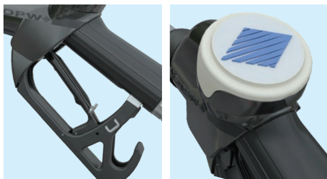
Poignée ergonomique, manipulation aisée du système de blocage