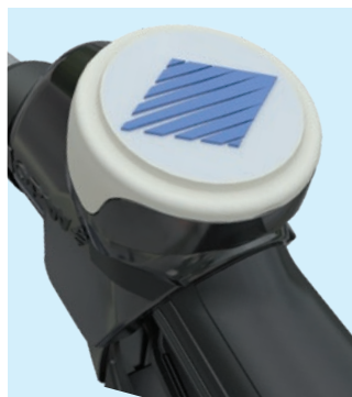
Large platine centrale (47mm) interchangeable pour affichage de message ou publicité. Onglet latéral disponible pour identification du produit

Concernant les références des pistolets et raccords, référez-vous à la brochure