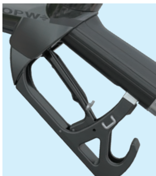
Poignée ergonomique, manipulation aisée du système de blocage