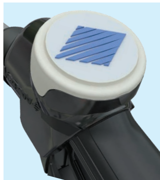
Large platine centrale (47mm) interchangeable pour affichage de message ou publicité. Onglet latéral disponible pour identification du produit

Concernant les références des pistolets et raccords, référez-vous à la brochure