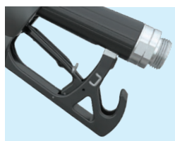
Ергономична ръкохватка, лесно закопчаване на петлото